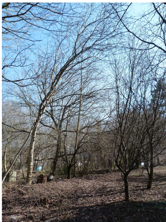
Malus domestica – příklad stromu vyžadující redukční řez