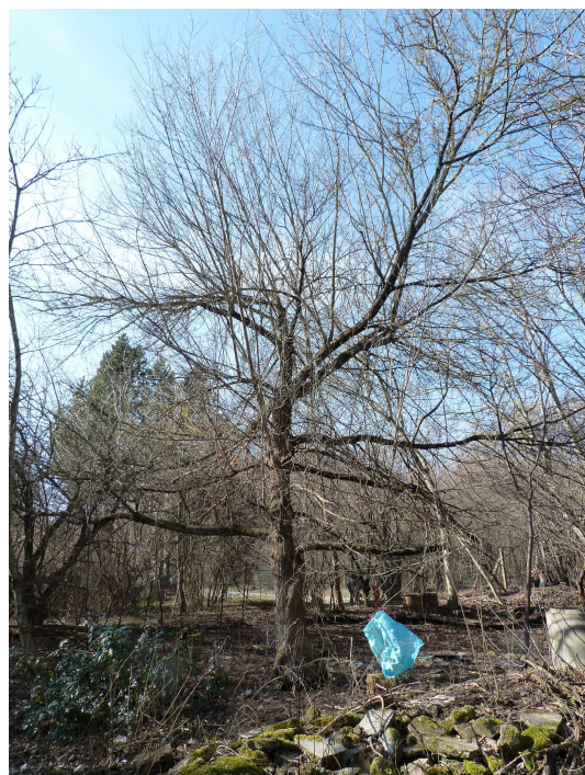
Acer negundo – příklad stromu vyžadujícího udržovací řez

Redukční řez – týká se zanedbaných jabloní, které jsou určeny k zachování. Cílem řezu je postupně během cca 5 let zapěstovat novou kvalitní korunu, která bude pak dále ošetřována formou udržovacího řezu.